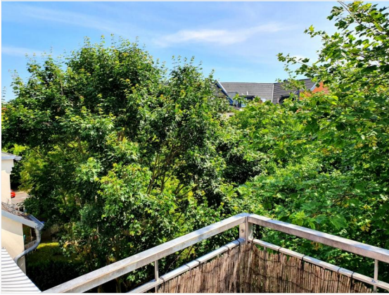
Ausblick vom Balkon